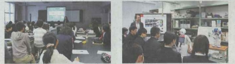
昨年の「公開講座」「出前講義」の様子